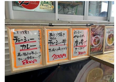
例：離れた場所からも見やすい商品名と価格